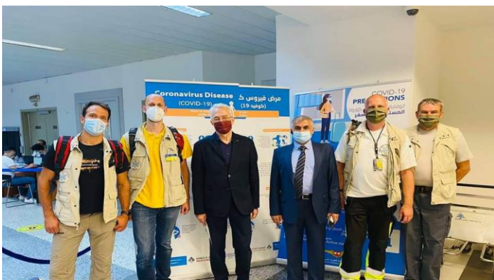
Találkozó a libanoni egészségügyi miniszterrel