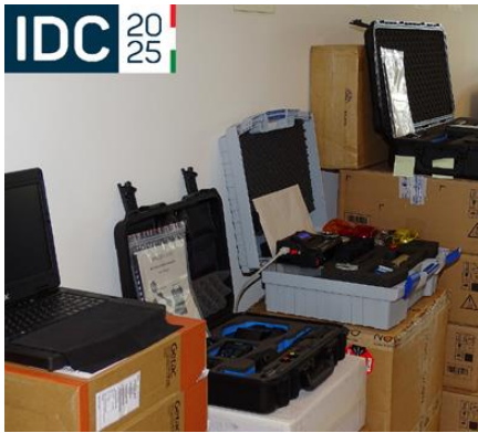
Kibervédelmi eszközök

iskolákban kialakított ún. „oázis központok” révén. A kormányzati és kritikus gazdasági-ipari infrastruktúra védelme érdekében hazánk továbbá egy Malware és Igazságügyi Elemző Laboratóriumot hozott létre Ugandában.