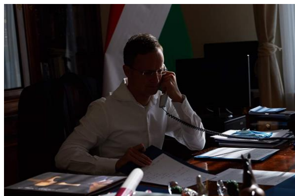
Telefonos egyeztetés az ugandai külügyminiszterrel

Szijjártó Péter külgazdasági és külügyminiszter 2020. július 3-án telefonos egyeztetést folytatott Sam Kutesa ugandai külügyminiszterrel az ugandai gazdaságfejlesztési együttműködési program folytatásáról. A COVID-19 pandémiás helyzet áttekintését követően Kutesa külügyminiszter köszönetét fejezte ki a gazdaságfejlesztési program vonatkozásában, amelynek keretében 2020-ig a COVID-19 válsághelyzet ellenére is befejeződtek a vízgazdálkodási, valamint a kibervédelmi programelemek.