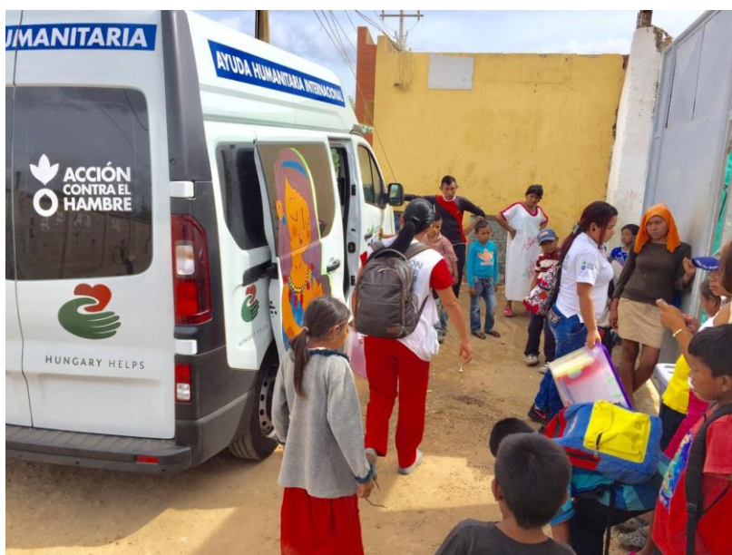
Mobil egészségügyi állomás

A kolumbiai La Guajira tartományban 2019 májusa óta nyújt kiemelkedő segítséget az a mobil egészségügyi állomás, ami a Külgazdasági és Külügyminisztérium támogatásának köszönhetően jött létre. A sikeres működést bizonyítja, hogy megnyitása óta 825 beteg – 627 öt éven aluli gyermek, 28 várandós, veszélyeztetett terhes, és 170 szoptatós kismama – egészségügyi ellátását biztosította a mobil állomás. A kolumbiai fél köszönetét fejezte ki Magyarország támogatásáért, amelynek eredményeként Kolumbia legszegényebb tartományában egészségügyi ellátásban részesült számos sérülékeny és szegénységben élő venéz és helyi lakos, akik egyéb eséllyel nem rendelkeztek orvosi kezelés igénybevételére.