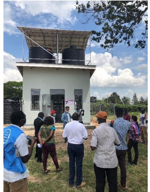
Oázis központok átadó ünnepsége

A program első fázisának részeként sikeresen végrehajtottunk egy vízgazdálkodási, valamint egy kibervédelmi projektet. A vízgazdálkodási projektnek köszönhetően a Külgazdasági és Külügyminisztérium közel 160 000 ember számára biztosít tiszta vízforrást a Rwamwanja menekültelepen található