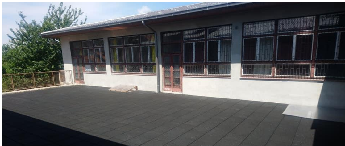
Saburina Általános Iskola felújított udvara

A sarajevói Stari Grad (Óváros) kerületében található Saburina Általános Iskola egy közös V4+Japán együttműködés keretében került felújításra. A Külgazdasági és Külügyminisztérium az iskola teraszának részleges felújításához járult hozzá. Az együttműködés keretében Szlovákia az iskola fűtési rendszerének modernizációját valósította meg. Lengyelország a könyvtár és a napközi felújítását biztosította, Csehország a mosdók, valamint a szaniterek felújítását vállalta, míg Japán az iskola régi – műemléki védelem alatt álló – épületrészének ablakkereteit újította fel egyedi fageretek felhasználásával. Az iskola felújítása befejeződött, az átadóra a helyi biztonsági előírások betartásával kerülhet sor.