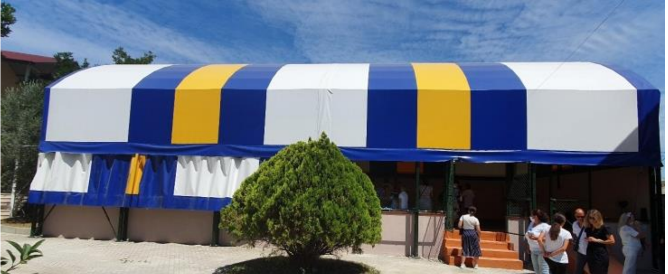
A Külgazdasági és Külügyminisztérium támogatásával megépült durresi sportpálya

Fedett sportpálya építésére és átadására került sor a Külgazdasági és Külügyminisztérium támogatásával a durresi Szent Dávid Plébánia sportfejlesztési programjának keretében. A sportpálya megépítésének támogatásával Magyarország jelentős segítséget nyújtott a mintegy húsz ezer fős durresi egyházközösség számára, hozzájárulva ezáltal a helyi keresztény közösség megmaradásához, valamint összetartozásának erősítéséhez. A sportpálya átadóünnepségére 2020. július 17-én került sor, amelynek keretében Balla Lóránt Magyarország tiranai nagykövete és George Anthony Frenco tiranai és durresi érsek átadta a pályát a helyi közösségnek.