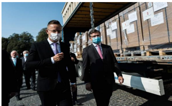
A lélegeztetőgépek szemléje Ungváron

Szijjártó Péter külgazdasági és külügyminiszter 2020. szeptember 23-i videójában számolt be az átadóról.